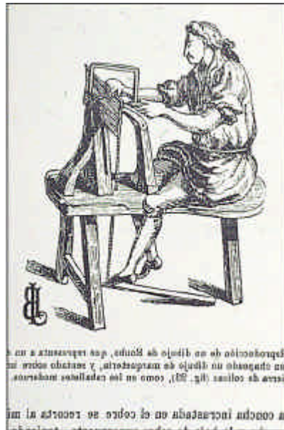
Banco de marquetero según Roubo.