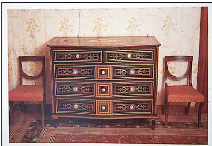
Cómoda mallorquina de la época de Carlos IV.